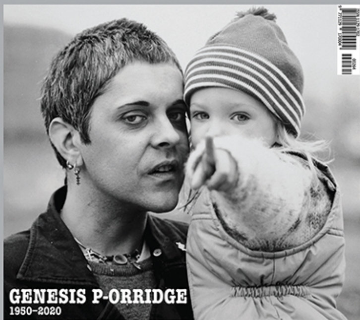
GENESIS P-ORRIDGE 1950-2020

MUSICA E ALTRI EFFETTI COLLATERALI ~ MENSILE #264 MAGGIO 2020 ~ € 7,00